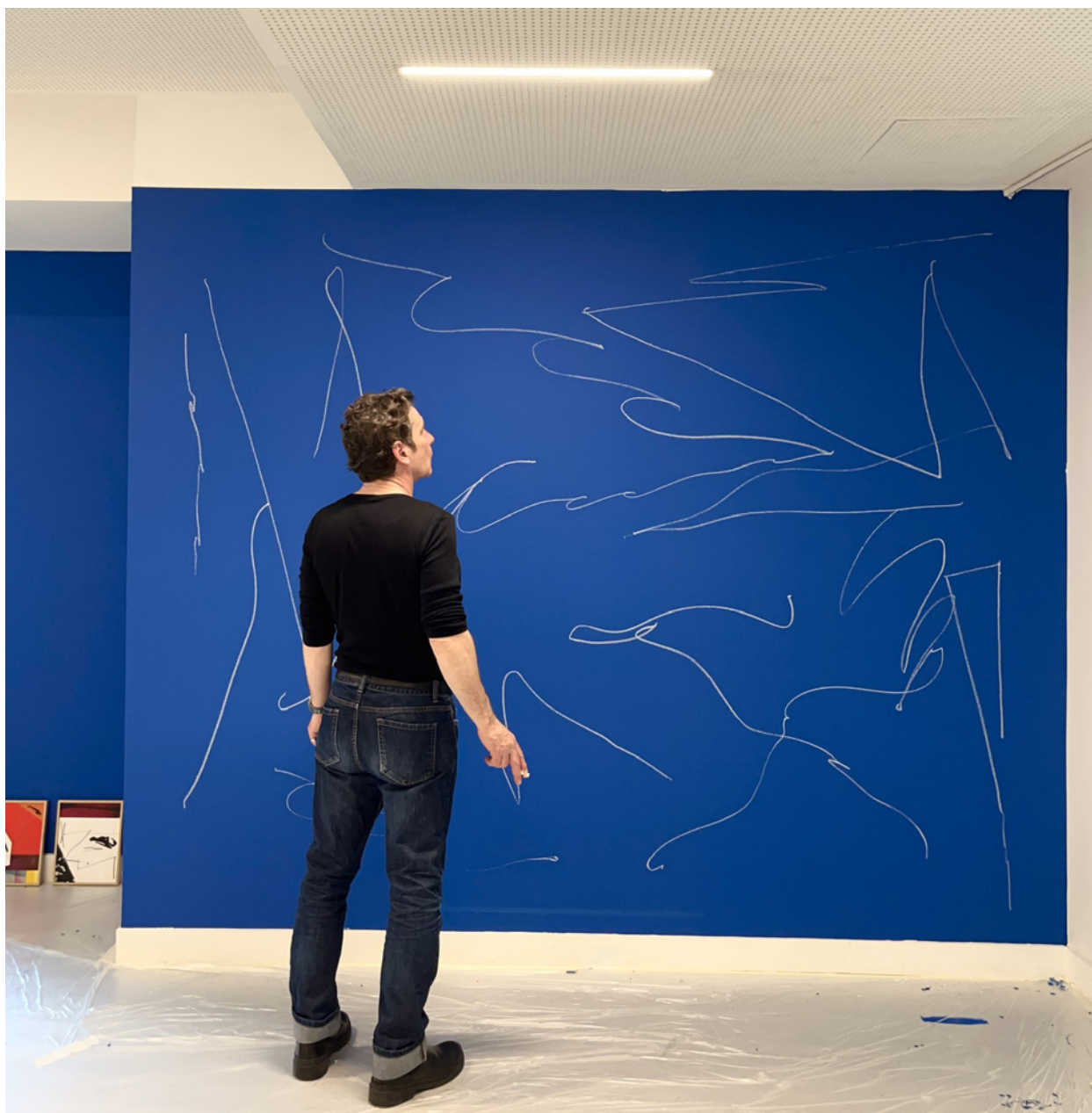
L'artiste en pleine création.