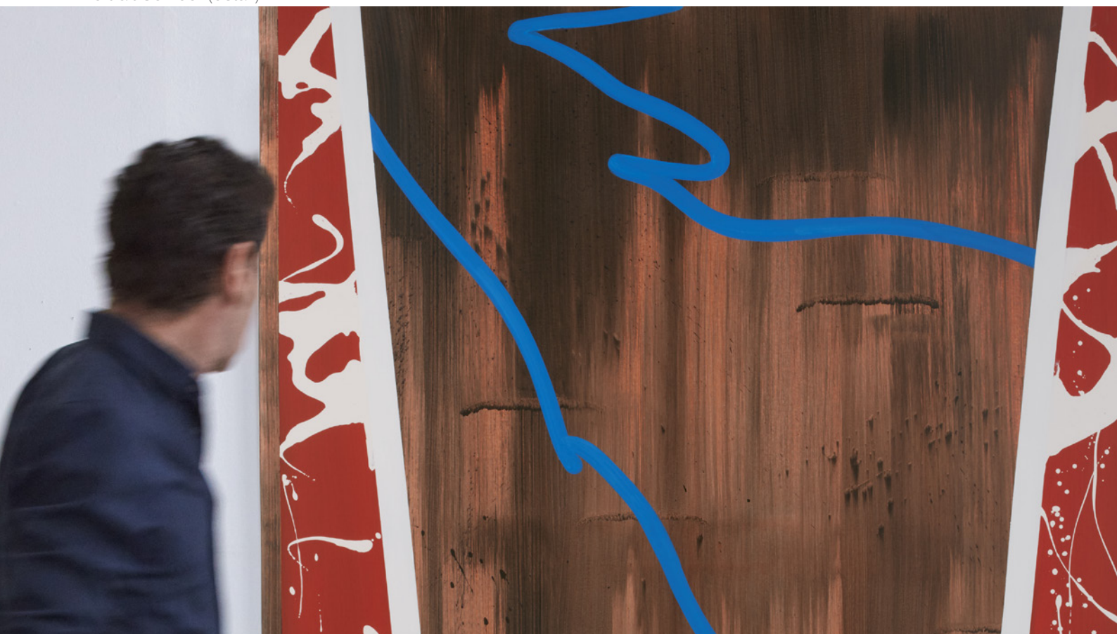
Portrait Corridor (détail)