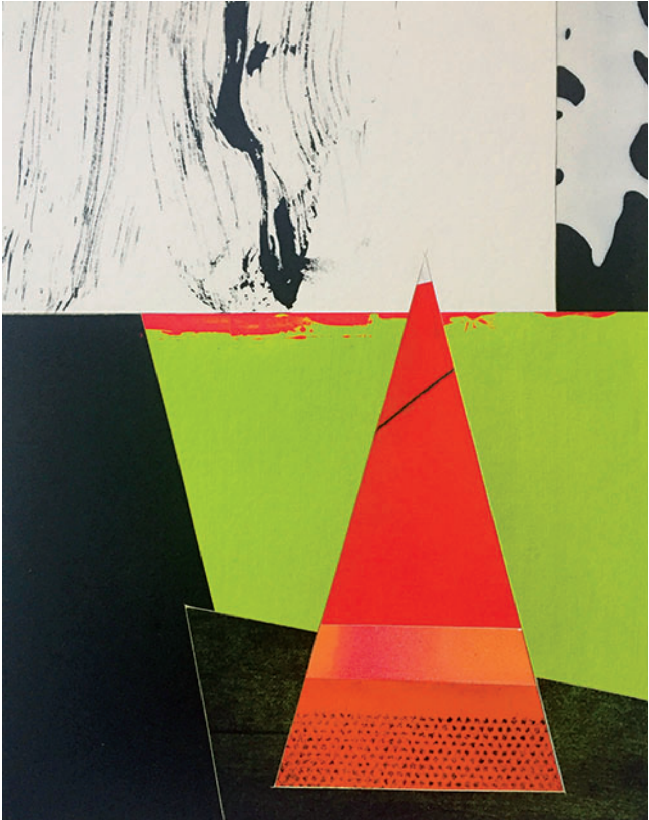
Débauche 1 , technique mixte sur papier, 30 x 24 cm