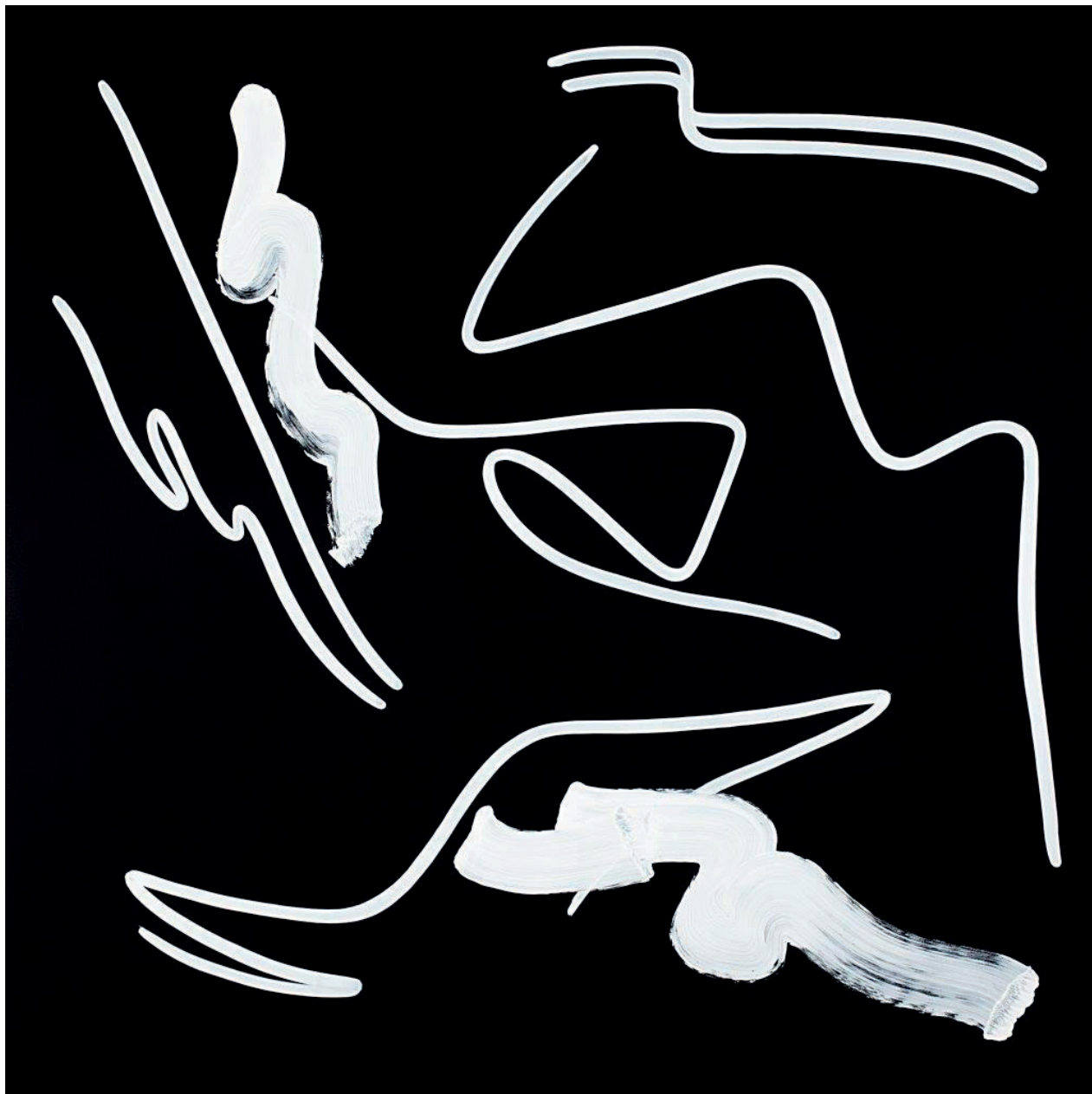
Sans titre , acrylique sur toile, 190 x 180 cm